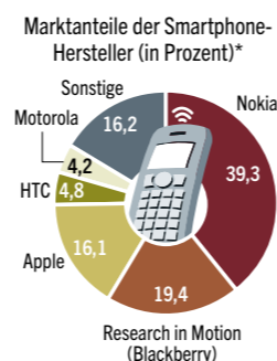
* weltweit, 1. Quartal 2010; Quelle: IDC

GIER NACH NEUEM Rund 55 Millionen Smartphones wurden allein im ersten Quartal 2010 weltweit verkauft. Neue Modelle heizen den Absatz an. Für die Prototypen interessieren sich nicht nur die Konkurrenten des Herstellers. Auch für Programmierer, die Software für die Kleincomputer schreiben, sind frühe Informationen Gold wert. Zudem gieren Konsumenten nach jeder Neuheit.